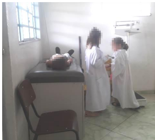
Figura 16 b