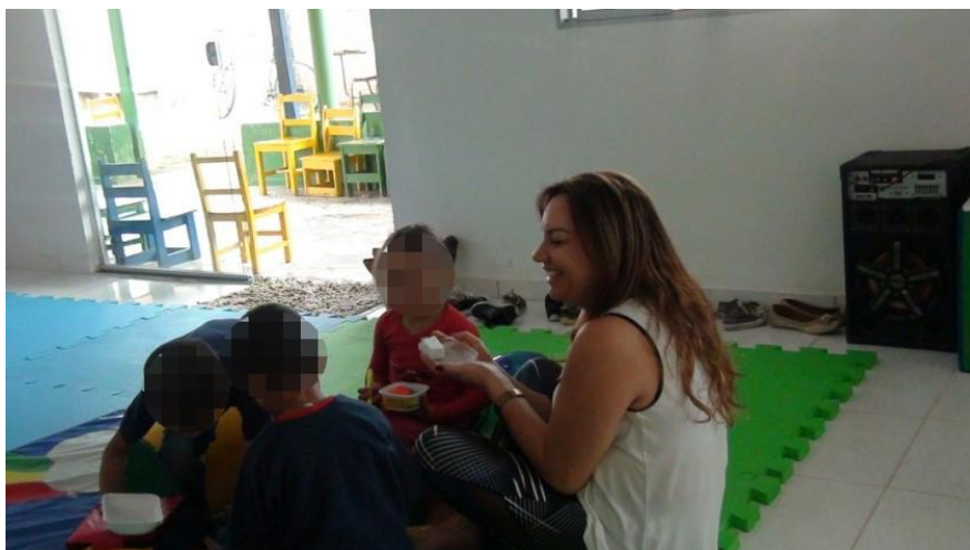
Figura 6 - Brincando de "Família"