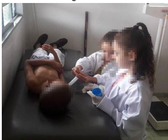
Figura 16 e