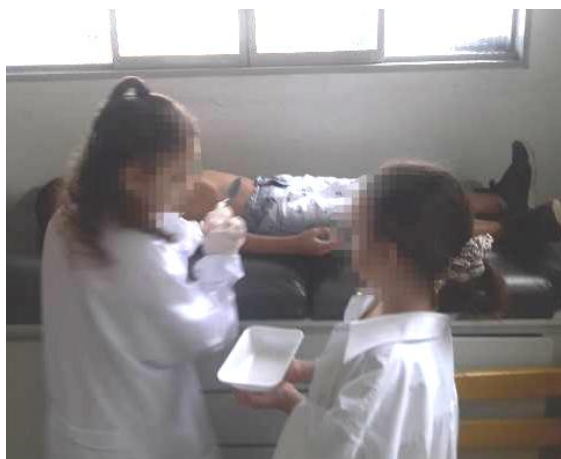
Figura 16 c