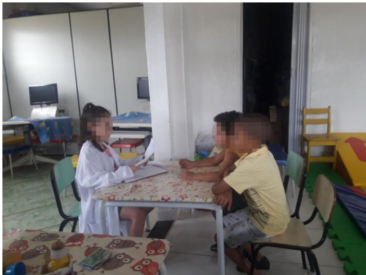
Figura 10 - As relações humanas como conteúdo da brincadeira