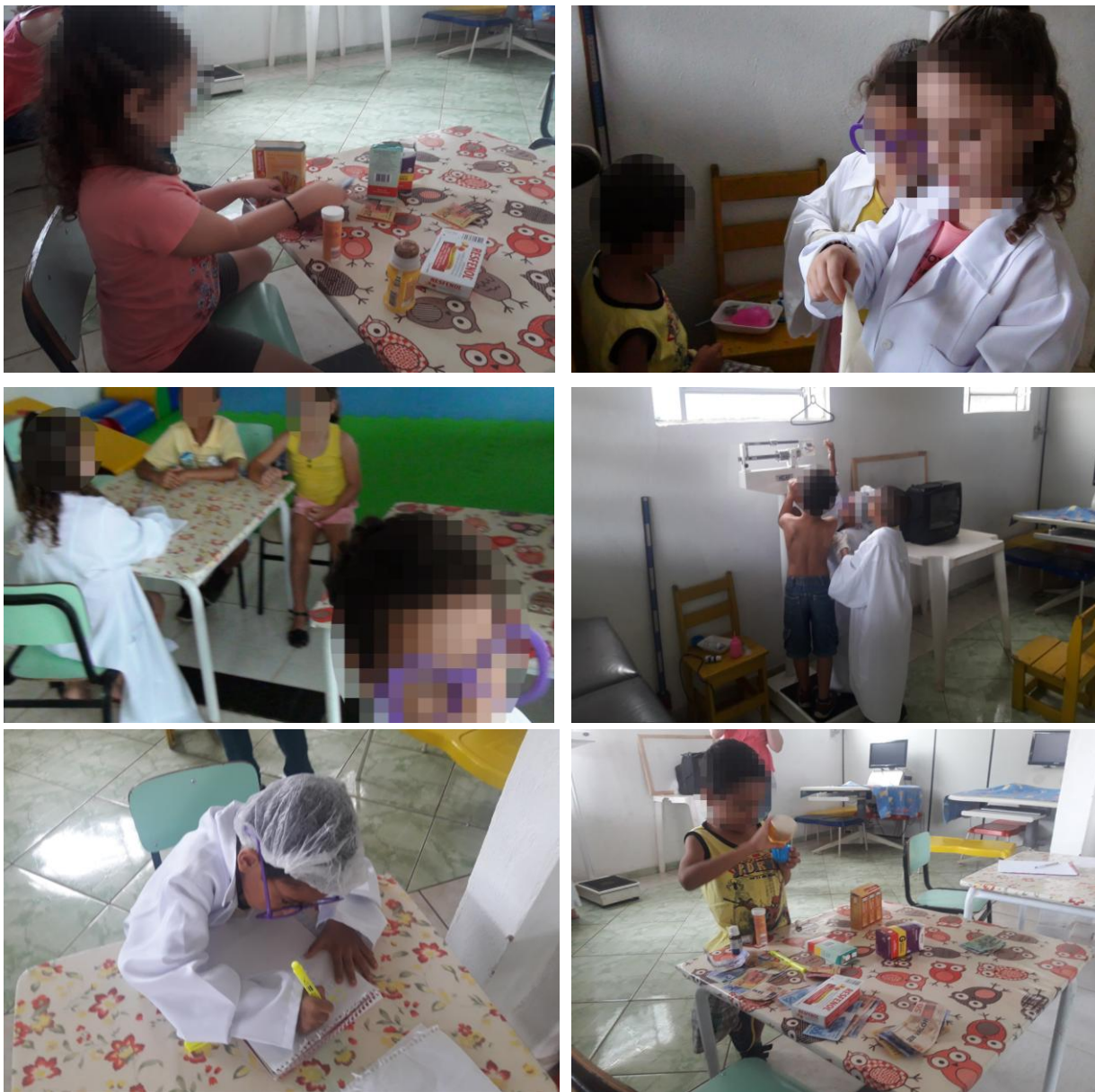
Figura 8 - A escolha dos papéis sociais e as trocas consensuais

internação do paciente, a cozinheira que fazia alimentação, o guarda responsável pela segurança, o diretor do hospital, entre outras funções sociais que não chegaram a ser reproduzidas pelas crianças, mas que lhes foram apresentadas.