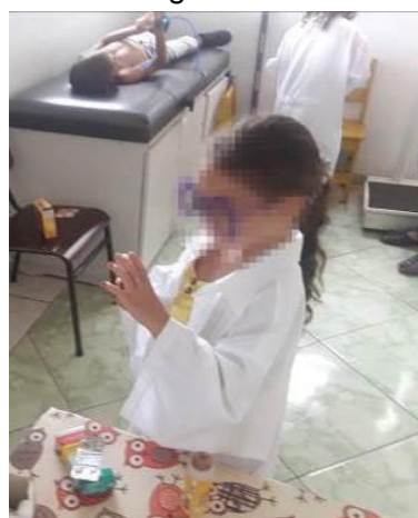
Figura 16 f