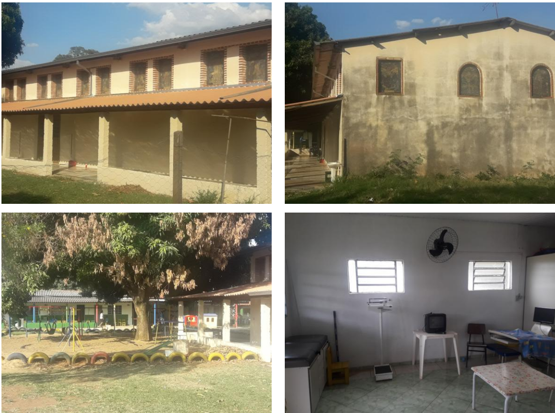
Figura 1 - Imagens da Creche São Jerônimo Emiliani

Em 31 de maio de 2017 apresentamos a proposta à equipe dirigente da Creche Comunitária São Jerônimo Emiliani, que foi acatada prontamente, sendo asseguradas as devidas condições objetivas para sua realização. Ao final de nossa exposição, a coordenadora solicitou-nos priorizar as crianças que apresentavam dificuldades cognitivas e haviam se matriculado após o início do ano letivo. Na verdade, a coordenadora atribuía os “déficits” de aprendizagem das crianças ao fato de haverem mudado de escola.