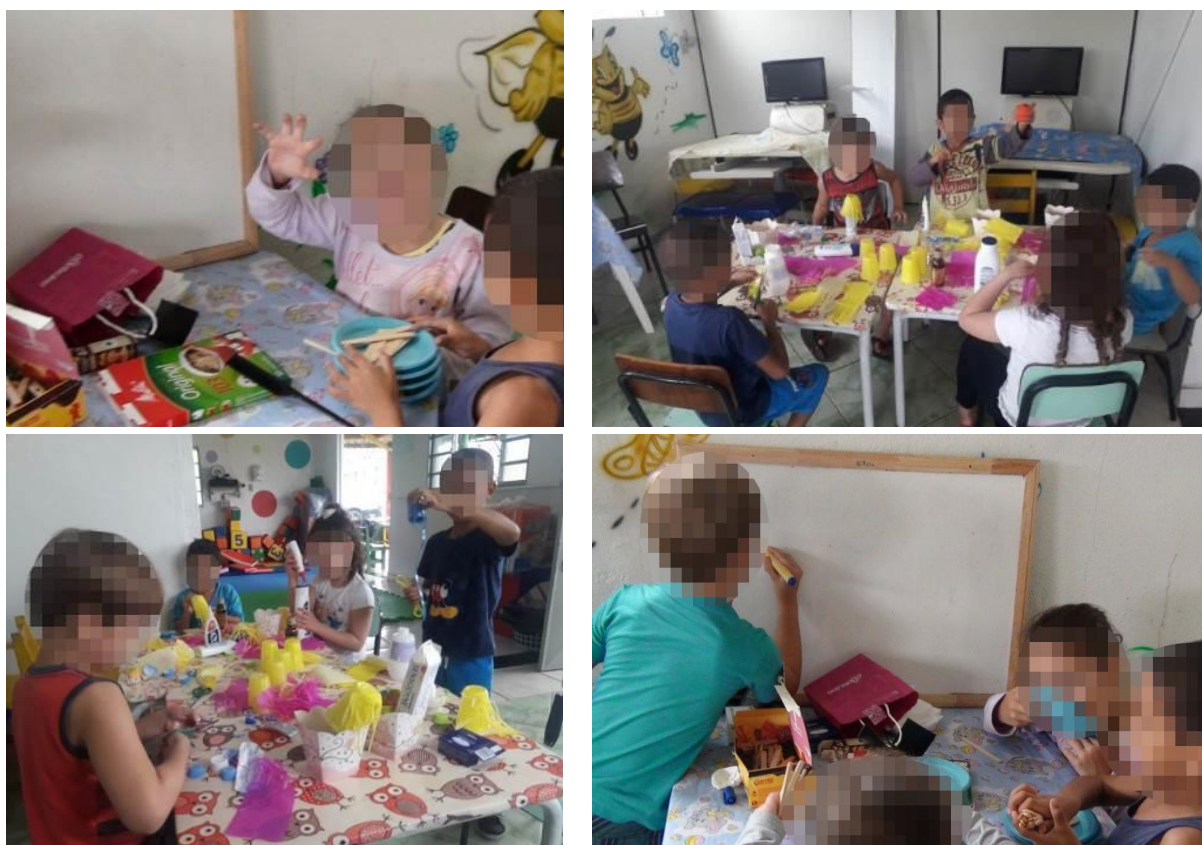
Figura 5 - Misturando diferentes objetos como possibilidade de novas combinações criadoras

papel, as ações e os objetos na brincadeira de papéis sociais e nos permite atentar para as mudanças que vão ocorrendo entre esses elementos na própria evolução da atividade.