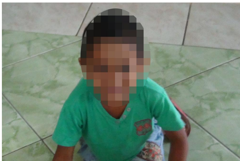
Figura 14 – Mateus protagoniza um gato