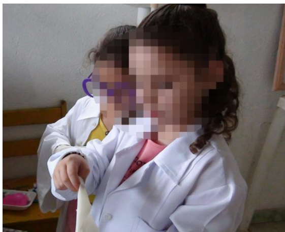
Figura 16 a