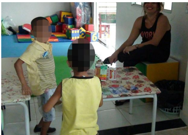
Figura 11 - Apropriando e significando as relações sociais