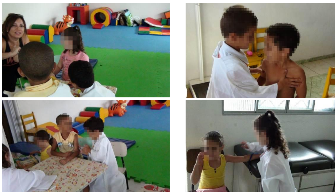
Figura 13 – O signo verbal como instrumento para construção do enredo na brincadeira de papéis sociais

Na Figura 13, as imagens mostram alguns dos momentos que denotam a evolução da atividade, a qual partiu das ações lúdicas com objetos temáticos em direção à protagonização do papel pelo uso da palavra, prescindindo do objeto material para sua realização. O signo/palavra representa essa materialidade. O uso da palavra em substituição ao objeto na realização da brincadeira de papéis sociais demarca o modo superior de objetivação da unidade mínima de análise da atividade, que é a necessidade convertida em motivo da ação, mediada pela linguagem.