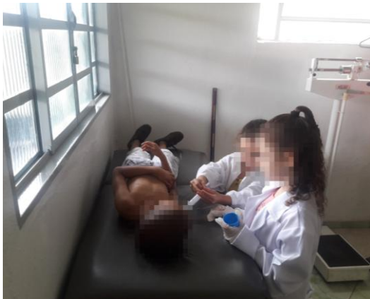
Figura 9 - O enredo é imaginário, mas o sentimento é real