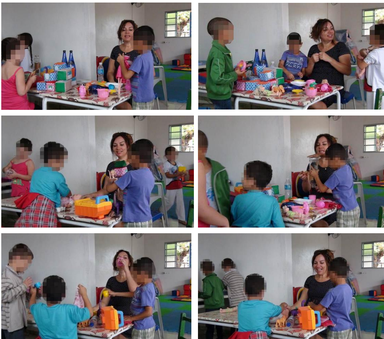
Figura 3 - Início da realização da brincadeira com objetos temáticos

entre os sujeitos na atividade. Cada criança se ocupa apenas de manusear os objetos que estão disponíveis, com limitados atos de criação. Isso parece indicar que a simples presença dos objetos temáticos no ambiente não garante as possibilidades de desenvolvimento de ações criativas com estes, apresentando-se, ao contrário disso, uma simples reprodução das ações humanas conhecidas.