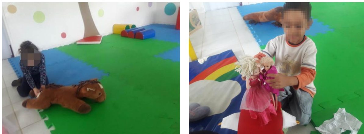
Figura 4 - Criação de conteúdo argumentativo na brincadeira com o suporte dos objetos temáticos

da aprendizagem da brincadeira porque são portadores das marcas das criações culturais da sociedade precedente.