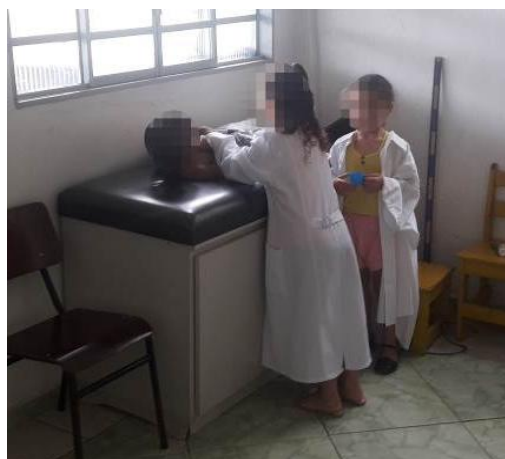
Figura 16 d